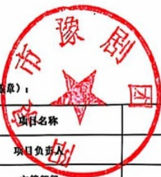
阳泉市项目支出绩效自评表