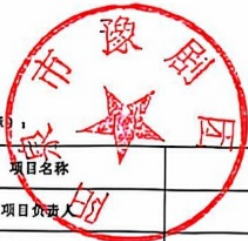
阳泉市项目支出绩效自评表